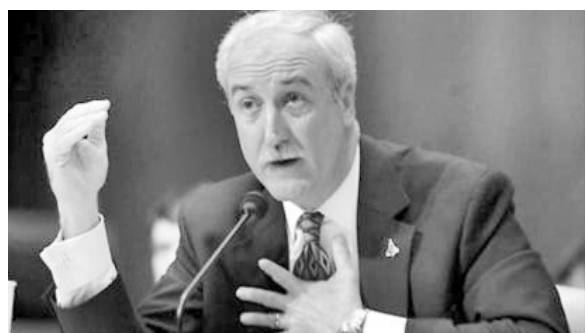
航空航天局前局长幸免于难

美国国家运输安全委员会8月10日下午公布了9日晚间坠毁在阿拉斯加的一架小飞机上9名人员名单。前参议员史蒂文斯等5人遇难,前航空航天管理局局长奥基夫父子等4人奇迹生还。