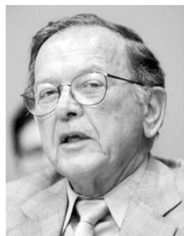
新联邦参议员不幸身亡