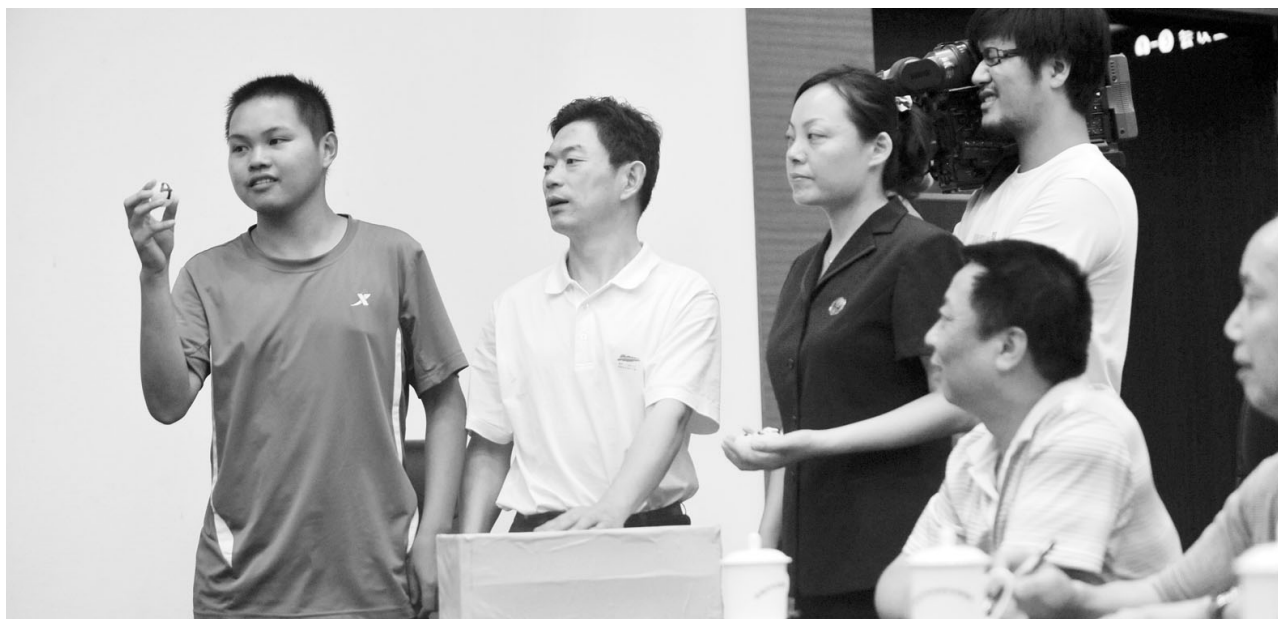
现场抽取参与听证会代表