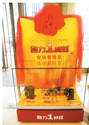
格力变频1赫兹尖端技术,现场展示

只有真正将消费者放在第一位,只有专心专业专注的把空调品质放在第一位,才能在汹涌的市场浪潮中勇往直前。