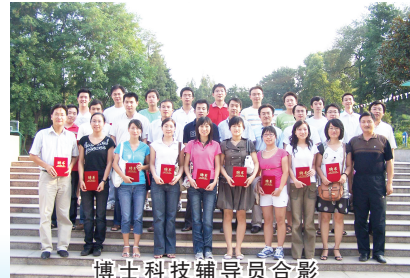
博士科技辅导员合影

咨询电话:0551-5591066 5593091 网址:school.hfcas.ac.cn