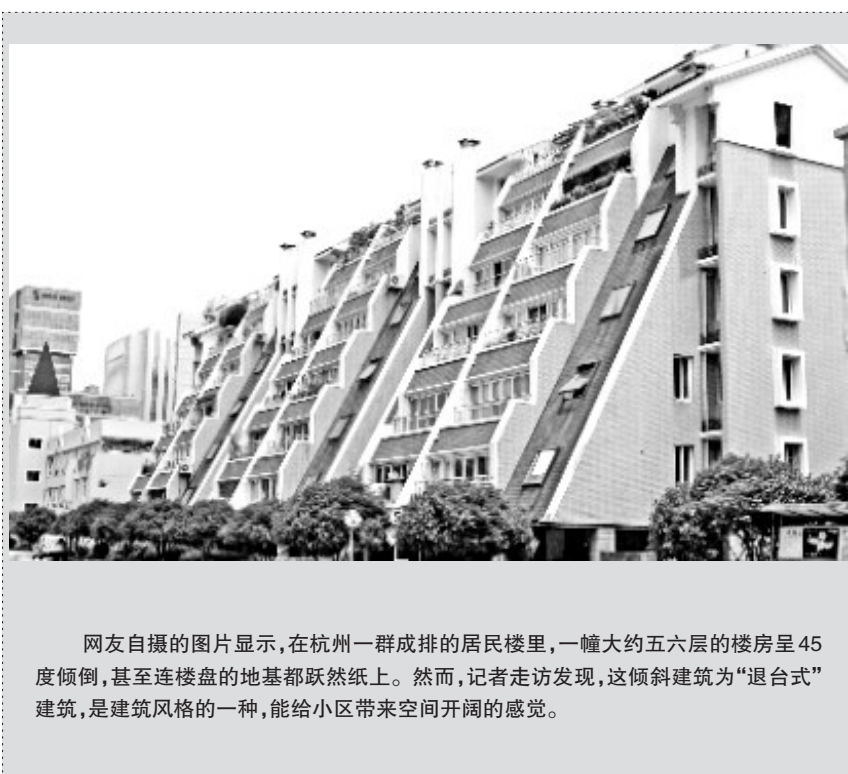
网友自摄的图片显示,在杭州一群成排的居民楼里,一幢大约五六层的楼房呈45度倾斜,甚至连楼盘的地基都跃然纸上。然而,记者走访发现,这倾斜建筑为“退台式”建筑,是建筑风格的一种,能给小区带来空间开阔的感觉。

据介绍,省著名商标享有推荐认定“中国驰名商标”的资格,并享受国家法律法规的特殊保护,安徽省著名商标在省内视同中国驰名商标保护。