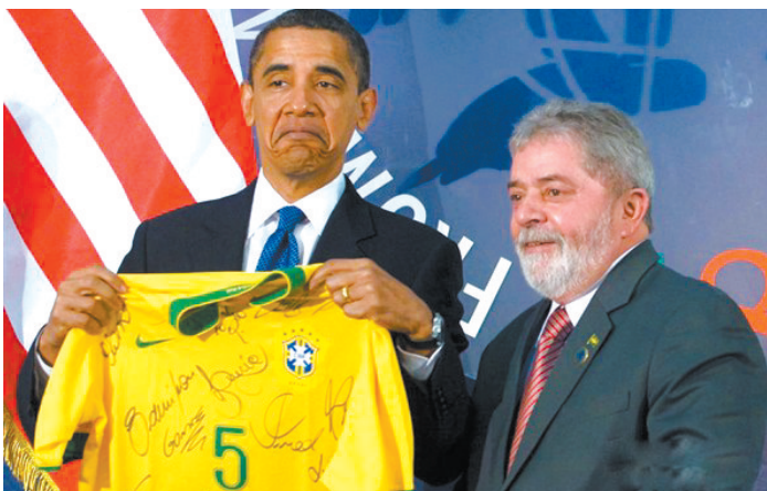
当地时间2009年7月9日,意大利拉奎拉,美国总统奥巴马手持一件巴西球队的签名球衣,旁边是巴西总统卢拉。奥巴马的表情够囧。