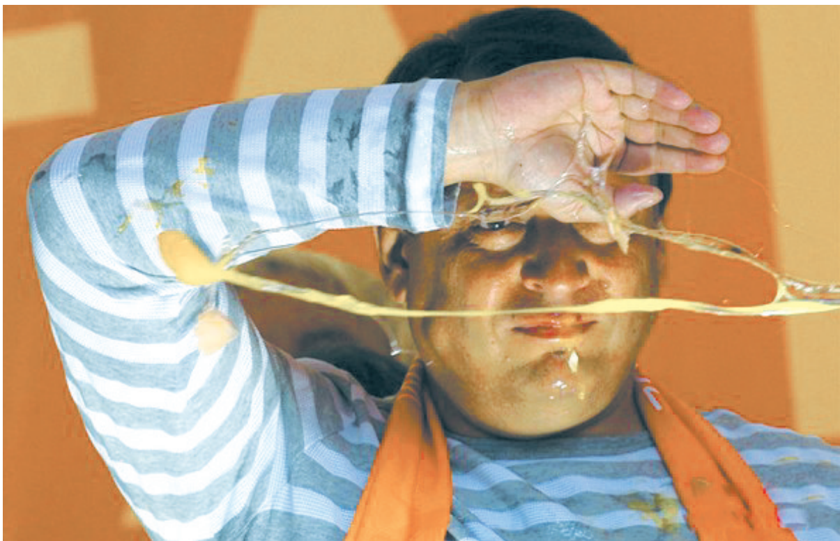
当地时间2009年5月27日,布拉格,捷克社会民主党主席Jiri Paroubek带领所在政党参加欧洲议会选举,席间遭对手鸡蛋攻击。

政要代表国家形象,他们多数时候都是衣冠楚楚一本正经的样子。而正因如此,各种各样的囧事更容易发生在他们身上,这大概就是破坏美学和冷幽默。不管怎样,我们还是挺愿意看到那些高高在上的大人们,在遭遇各式各样的尴尬时的表情。这样可以提醒我们,他们其实跟我们有着一样的喜怒哀乐,悲欢贫瘠。