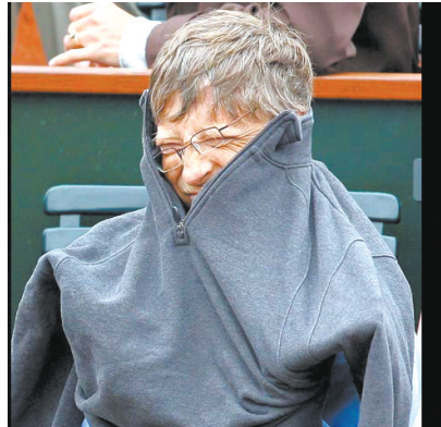
当地时间2009年6月6日,法国巴黎,比尔·盖茨现身09法国网球公开赛观看比赛,感觉凉意连忙穿衣服,可惜心急吃不了热豆腐,怎么套也套不进去,表情滑稽令人啼笑皆非。