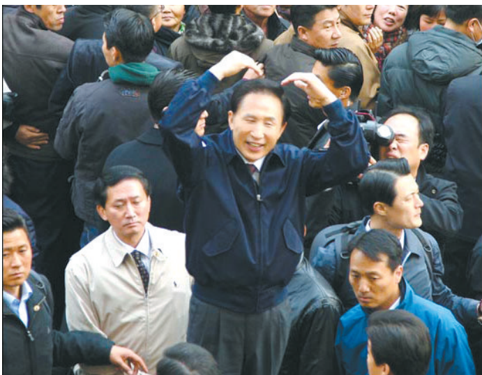
当地时间2009年12月2日,韩国总统李明博站在人群中,学韩剧《浪漫满屋》中的经典姿势,把双手放在头顶做心形,扮可爱雷倒众人。