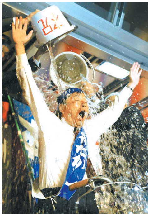
当地时间2009年4月26日,日本名古屋,在市长选举中获胜的前反对党议员河村隆被庆祝者当头浇了一桶水。