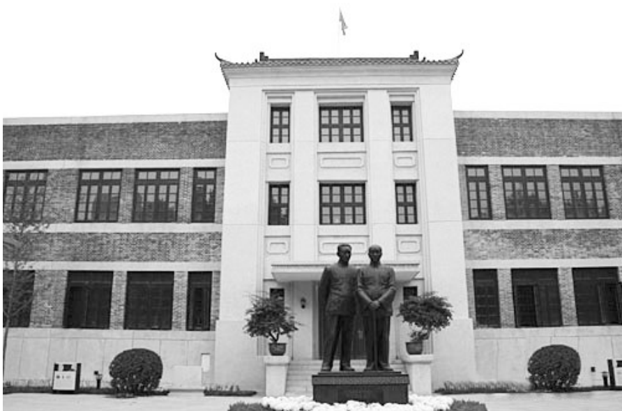
石家庄市中华北街的小楼,中国人民银行在这里诞生