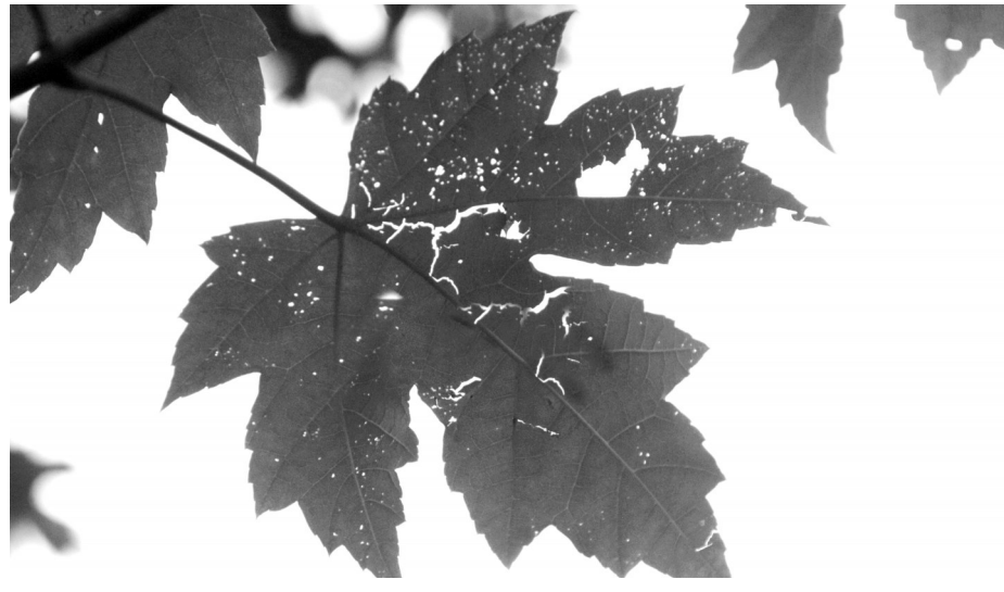
红枫树叶受到叶螨和天牛的危害

炎炎夏季,树荫可以为我们遮挡烈日的暴晒。然而,记者从合肥市园林局获悉,随着天气的日渐炎热,省城不少行道树、景观树木都“生病”了,树叶出现了不同程度的脱落。这些树木患了何种病?园林专家又是如何把脉诊断、开处方的呢?昨日,记者进行了深入采访,并邀请了相关园林专家进行分析。张新正 记者 赵莉文 王婧莹 图