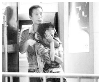
谢某劫持女人质与警方对峙

7月6日晚,一名湖北籍男子在广州市越秀区站南路抢劫未遂遭警方追捕,途中竟丧心病狂劫持一弱女子与警方对峙。晚9时30分,警方发现男子伤害女事主,一名英勇的女特警果断连开4枪击毙男子,受刀伤的女人质被成功解救。星报综合报道