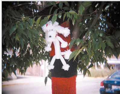
3 黄色温泉(俄亥俄州)

点评:在美国,有这样的一些很酷的小镇,它们的人口都不到一万,但是它们的美食、文化、生活质量都足以与大城市媲美。