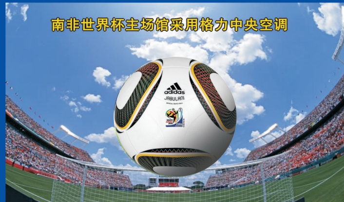
南非世界杯主场馆采用格力中央空调

冰冻时间: 6月30日18:00-7月4日22:00, 仅此100小时。 冰冻地点: 全市格力专卖店、五星、国生、百大、国美。