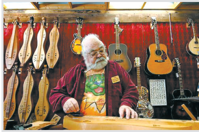
1 马尼图斯普林斯(科罗拉多州)