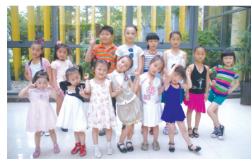
部分晋级小选手合影

轩,当看到同组的两位小朋友都拿到了晋级的PASS卡时,小家伙开始着急了,一直拉着妈妈问,“为什么我没有那个牌子?我要那个牌子!”拗不过这个小赖皮,妈妈带着他找到工作人员,终于让他一偿心愿,抱着“心爱”的PASS卡,照了一张相片,成了本场比赛里拿到PASS卡却没有晋级的选手。