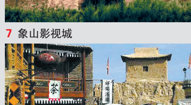
8 镇北堡西部影视城

点评:提到中国的古装影视剧,就一定会联想到被誉为“江南第一镇”的横店,这里是亚洲最大的影视拍摄基地,已有500余部影视作品在横店取景拍摄,有“东方好莱坞”的美誉。